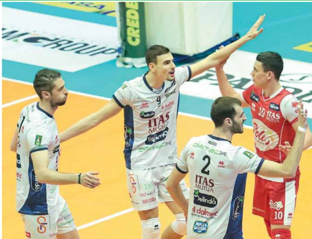
• L'esultanza dell' Itas Trentino